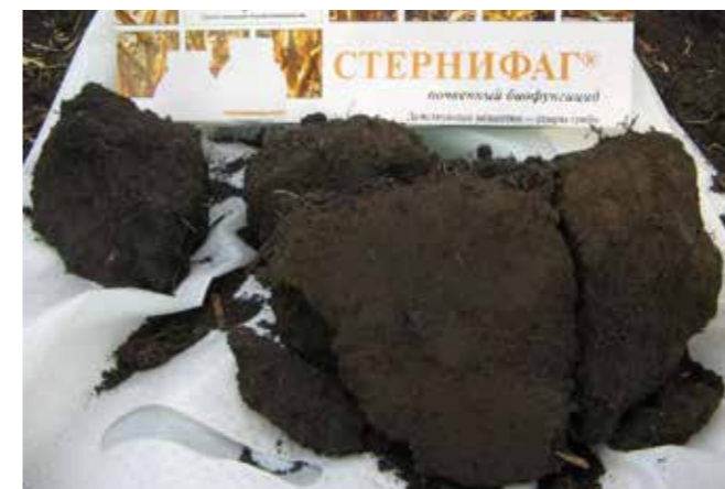
▼ Пробы почвы, отобранные с участков, обработанного Стернифаг, СП (слева) и не обработанного (справа)