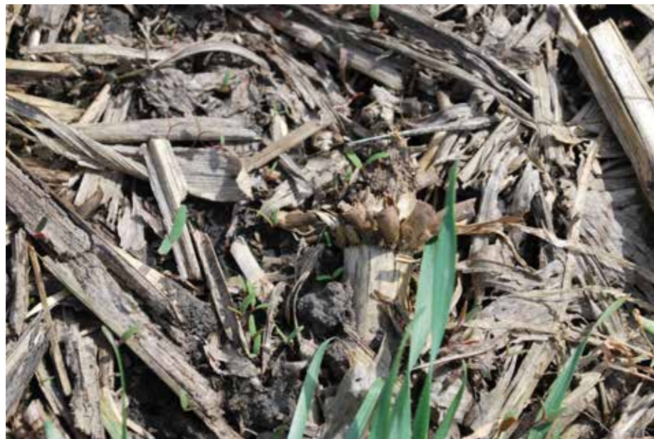
▲ Так выглядит поле после уборки кукурузы

После уборки урожая на полях остается масса растительных остатков, инфицированных возбудителями заболеваний. Вся эта целлюлозосодержащая масса должна быть обеззаражена от фитопатогенов и переведена в доступное для растений и микробов органическое удобрение, так необходимое для повышения плодородия почвы