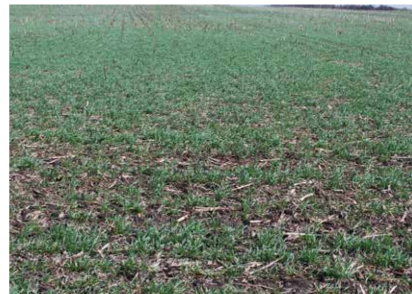
▲ Пшеница озимая, посеянная по предшественнику кукурузе

Грибные заболевания растений не только снижают урожай, но и значительно ухудшают его качество. Грибы р. Fusarium в процессе жизнедеятельности выделяют токсичные вторичные метаболиты – микотоксины (фузариотоксины), в результате